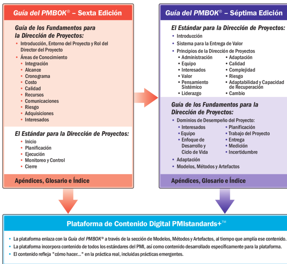
Figura 4: Relación entre la 6ª y la 7ª edición de la Guía del PMBOK

La aparente discrepancia entre los planteamientos de las dos últimas versiones de la Guía del PMBOK® que nos ocupa queda desacreditada al entender su complementariedad. En los siguientes apartados presentamos los argumentos que dan pie a esta interpretación.